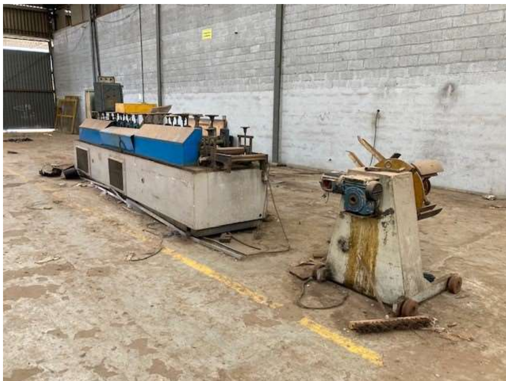
ITEM 1,001 - VISTA DA MAQ Nº 2 - DESBOBINADOR ACIONADO POR MOTOR E REDUTOR, PAINEL DE COMANDO, PERFILADEIRA COM 14 CASTELOS