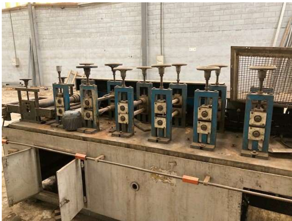
ITEM 1,001 - VISTA DA MAQ Nº 2 - DESBOBINADOR ACIONADO POR MOTOR E REDUTOR, PAINEL DE COMANDO, PERFILADEIRA COM 14 CASTELOS