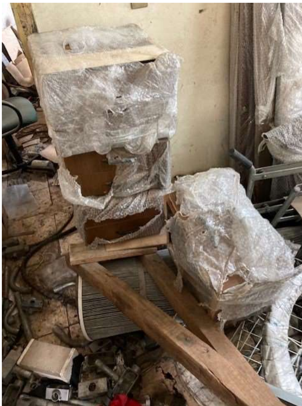
ITEM 2,002 - VISTA DAS MESAS DE MADEIRA COM 3 GAVETAS (GAVETAS)