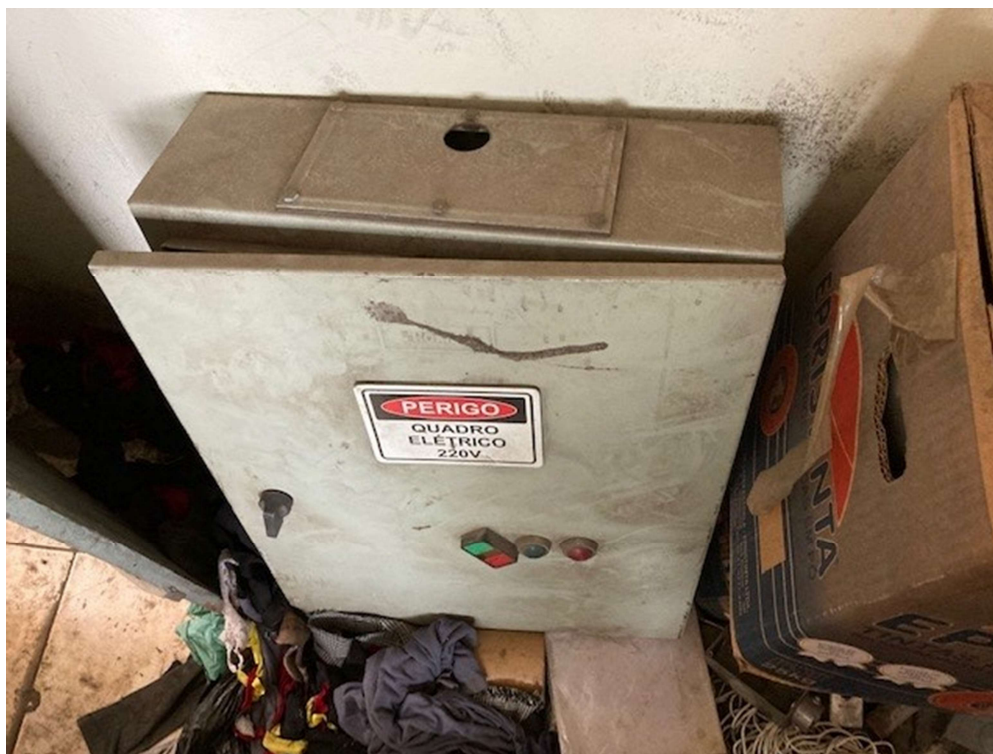
ITEM 4,002 - VISTA DA CAIXA METALICA (PAINEL)