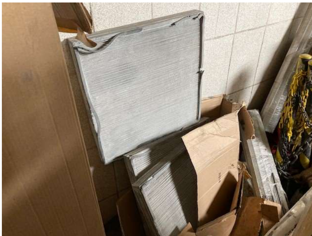
ITEM 4,001 - VISTA DO FILTRO DE PÓ