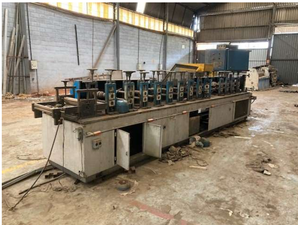
ITEM 1,001 - VISTA DA MAQ Nº 2 - DESBOBINADOR ACIONADO POR MOTOR E REDUTOR, PAINEL DE COMANDO, PERFILADEIRA COM 14 CASTELOS