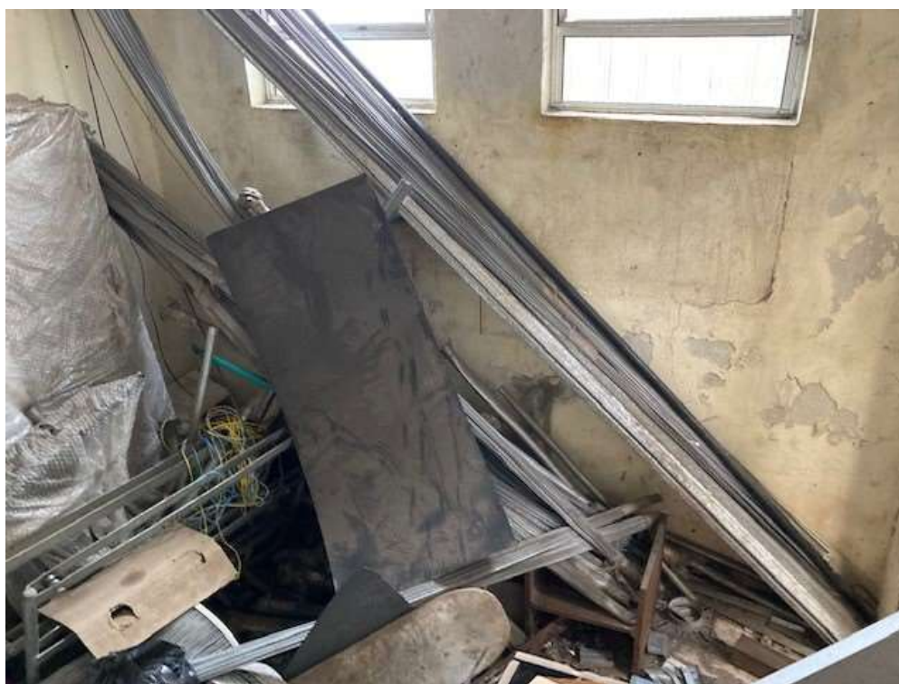
ITEM 4,003 - VISTA DE SUCATAS DE FERRO