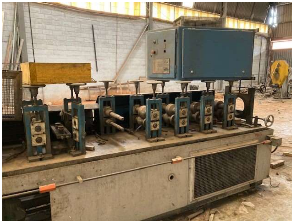
ITEM 1,001 - VISTA DA MAQ Nº 2 - DESBOBINADOR ACIONADO POR MOTOR E REDUTOR, PAINEL DE COMANDO, PERFILADEIRA COM 14 CASTELOS