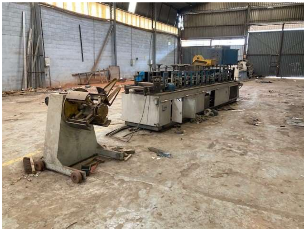
ITEM 1,001 - VISTA DA MAQ Nº 2 - DESBOBINADOR ACIONADO POR MOTOR E REDUTOR, PAINEL DE COMANDO, PERFILADEIRA COM 14 CASTELOS