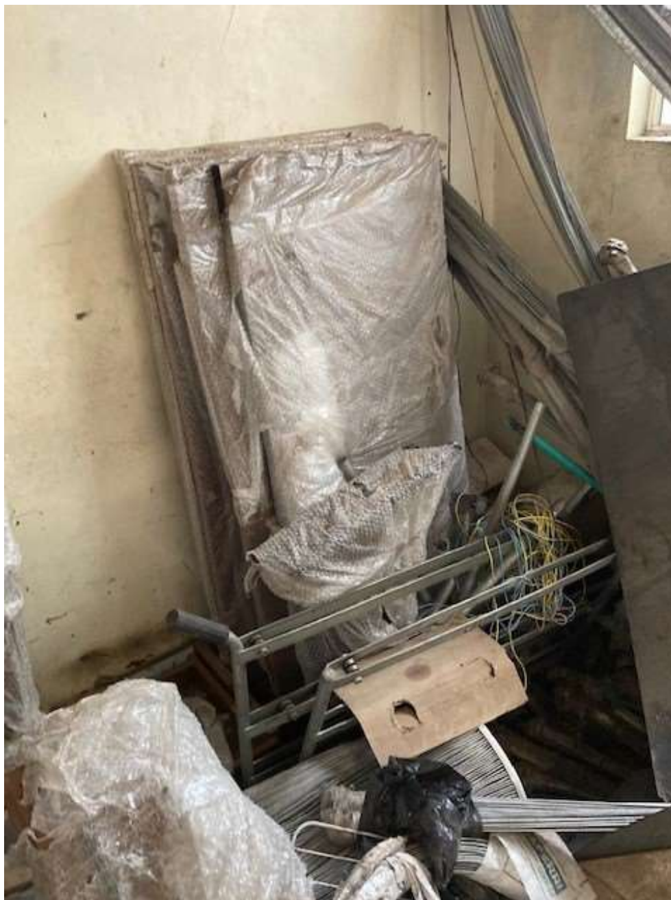
ITEM 2,002 - VISTA DAS MESAS DE MADEIRA COM 3 GAVETAS (TAMPOS)