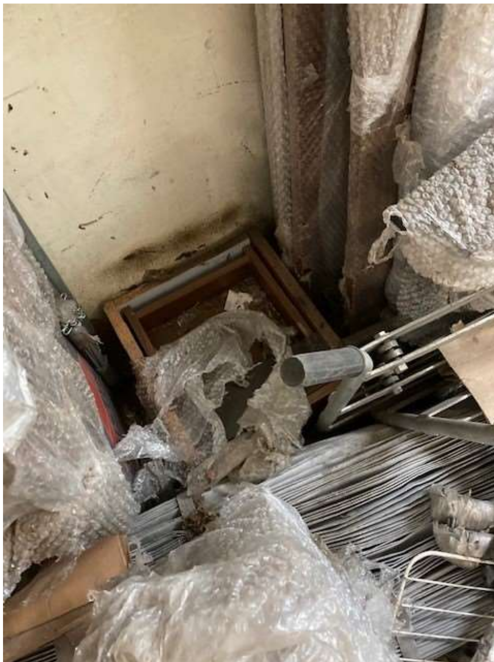
ITEM 2,002 - VISTA DAS MESAS DE MADEIRA COM 3 GAVETAS (GAVETAS)