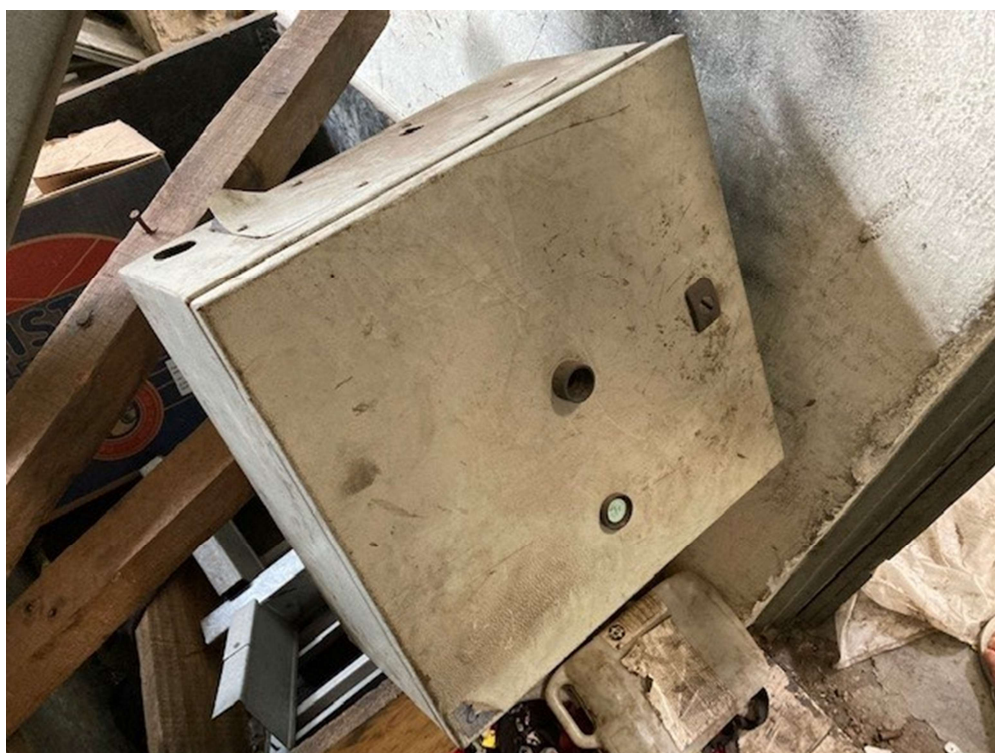
ITEM 4,002 - VISTA DA CAIXA METALICA (PAINEL)