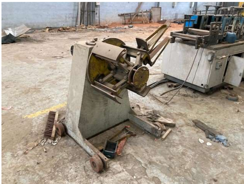
ITEM 1,001 - VISTA DA MAQ Nº 2 - DESBOBINADOR ACIONADO POR MOTOR E REDUTOR, PAINEL DE COMANDO, PERFILADEIRA COM 14 CASTELOS